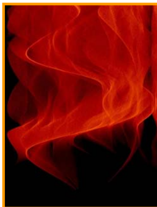
Un petit détail esthétique de cartographie de diffusion inélastique de \text{LaFe}_4\text{Sb}_{12} (moyenne sur poudre) calculée avec la méthode PALD.

Longtemps, on a considéré que certains matériaux intéressants pour les applications thermoélectriques pouvaient se comporter comme des « cristaux électroniques et verres de phonons » [1]. Il a été proposé que la faible conductivité thermique nécessaire pour un bon rendement thermoélectrique était une conséquence de mouvements atomiques décrits par des modes 'hochets' ( rattling ) qui atténuent la propagation des phonons acoustiques responsables du transport de chaleur par le réseau. Dans leur article récemment paru en ligne, M. Koza et al. (collaboration ILL et Université de Montpellier) montrent que le concept de verre de phonons ne peut pas expliquer la dynamique du réseau dans des skutterudites,